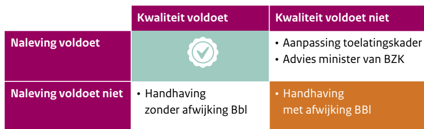
Figuur 3: Samenhang nalevingstoezicht en kwaliteitstoezicht

Figuur 3 geeft de samenhang weer tussen nalevingstoezicht en kwaliteitstoezicht. De TloKB kan immers bij haar kwaliteitsinspecties ook tekortkomingen constateren in de naleving en vice versa. De TloKB zal bevindingen tijdens kwaliteitsinspecties met betrekking tot de naleving meenemen in het nalevingstoezicht. Bevindingen tijdens de nalevingsinspectie met betrekking tot de kwaliteit kan de TloKB in het kwaliteitstoezicht meenemen.