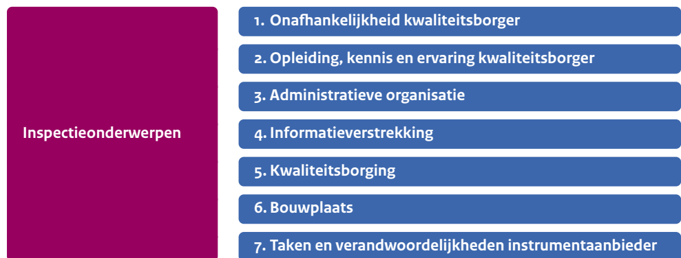
Figuur 2: Inspectieonderwerpen

De TloKB heeft hiervoor de toelatingscriteria herschreven naar inspectiecriteria en daaraan inspectievragen toegevoegd zie Inspectiekader KB-stelsel . Ook heeft de TloKB in dit inspectiekader de inspectiecriteria onderverdeeld naar de volgende inspectieonderwerpen, die als basis dienen voor de uitvoering van de inspectie.