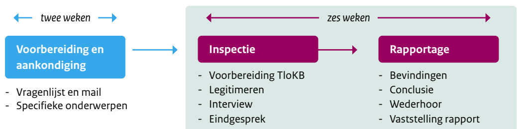
Figuur 3: Inspectieschema

De TloKB heeft de mogelijkheid de toezichttermijn, onder vermelding van een motivatie, te verlengen met de daarvoor benodigde tijd.