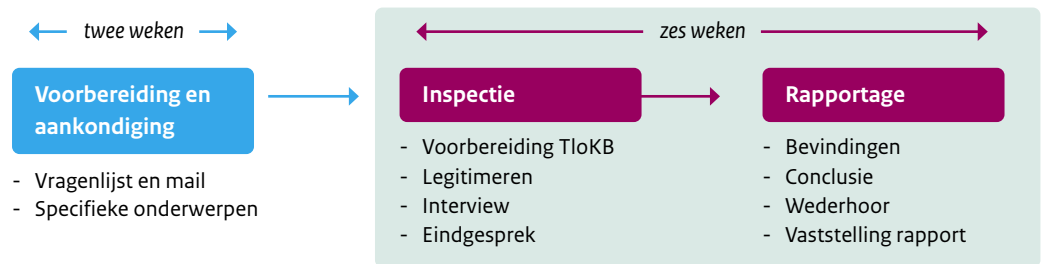
Figuur 5: Inspectieschema