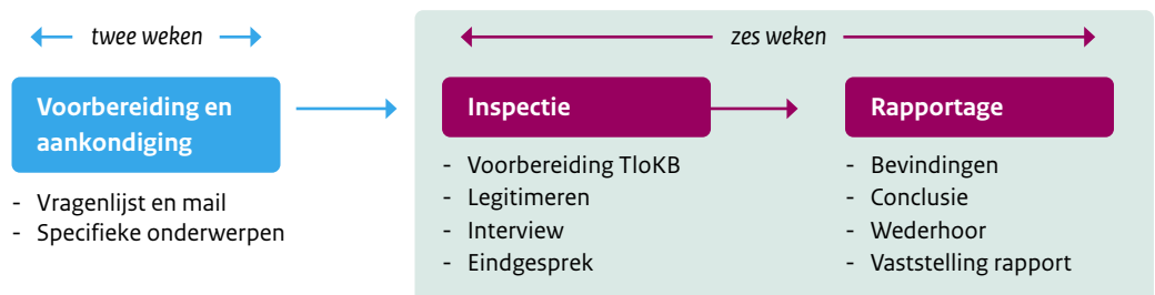
Figuur 6: Inspectieschema

De TloKB heeft de mogelijkheid de toezichttermijn, onder vermelding van een motivatie, te verlengen met de daarvoor benodigde tijd.